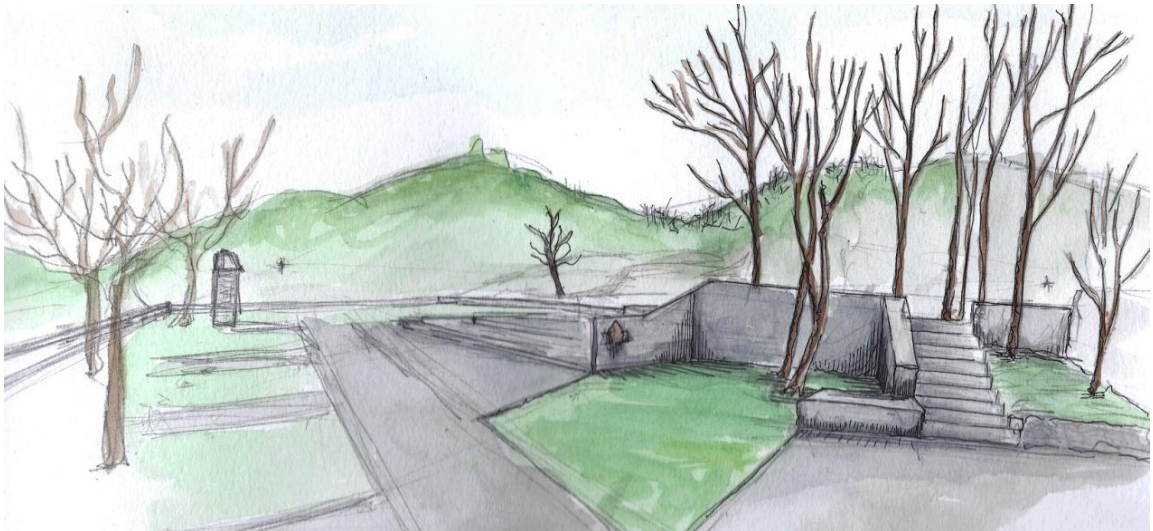
Εικόνα 2: Σκίτσο της πρότασης από την βορειοανατολική πλευρά του γηπέδου

Στο χώρο σήμερα, εκτός του επικλινούς του γηπέδου, υπάρχουν δύο επίπεδα, το πρώτο είναι ένας βυσσινόκηπος, βορειοδυτικά του γηπέδου, που υψώνεται 1,60μ από τον περίγυρό του και αποτελούσε τον χώρο του παλαιού δημοτικού σχολείου· το δεύτερο επίπεδο είναι η βάση του λυόμενου σχολείου από οπλισμένο σκυρόδεμα που υψώνεται 0,65μ από τον περίγυρό του. Δυτικά του βυσσινόκηπου υπάρχει παλαιά διαρρηγμένη λιθοδομή διαστάσεων περίπου 10,30x1,50x0,50μ. Στον ίδιο χώρο και στην ίδια πλευρά υπάρχει παλαιό λιθόκτιστο κτίσμα διαστάσεων 4,95x2,00x3,65μ με χρήση τουαλετών του σχολείου. Στην ανατολική πλευρά του βυσσινόκηπου υπάρχει τσιμεντένια κλίμακα πρόσβασης με 9 ρίχτια που ενώνει τη στάθμη του βυσσινόκηπου με τον περιβάλλοντα χώρο. Στη στάθμη της βόρειας εισόδου του γηπέδου και στο όριό του με το μονοπάτι υπάρχει παλαιά ερειπωμένη ασκεπής αποθήκη με διαρρηγμένες λιθοδομές διαστάσεων 3,70x2,50x7,30μ (εικόνα 7). Στον ευρύτερο περιβάλλοντα χώρο βρίσκονται διάσπαρτα 3 προτομές, ένα μνημείο πεσόντων και μία καμπάνα ιστορικής σημασίας και μνήμης 1 (εικόνα 8). Στο κέντρο του γηπέδου και ανατολικά υπάρχει λιθόκτιστη βρύση και νότια αυτής παλαιός και κατεστραμμένος εξοπλισμός παιδικής χαράς. Το γήπεδο είναι περιφραγμένο με λιθοδομή πάχους 0,50μ και κυμαινόμενου ύψους περίπου 0,50μ χωρίς στέψη και κάγκελο με εξαίρεση τις πλευρές των εισόδων. Η υπάρχουσα βλάστηση απαρτίζεται από τον βυσσινόκηπο που είναι καλυμμένος με μικρά και μεγάλα δέντρα και από τρεις αμυγδαλιές και μία καρυδιά.