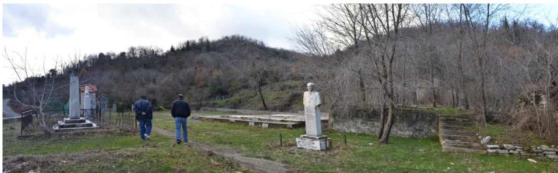
Εικόνα 1: Φωτογραφία της υπάρχουσας κατάστασης από την βορειοανατολική πλευρά του γηπέδου

Το γήπεδο (Α-Β-Γ-...-Ψ-Ω-Χ1-Χ2-Χ3-) βρίσκεται στον Άγιο Σώστη του Δήμου Οιχαλίας, νότια του οικιστικού ιστού του χωριού, σε θέση ιδιαίτερου περιβαλλοντικού ενδιαφέροντος και έχει έκταση 2038,74 τ.μ.. Ανατολικά έχει πρόσοψη σε δημοτική οδό, νότια σε κοινόχρηστο χώρο, δυτικά συνορεύει με ιδιοκτησία Συρμόπουλου Ευάγγελου και βόρεια με χωμάτινο μονοπάτι. Έχει υψομετρική διαφορά περίπου 3,00μ από τη στάθμη του δημοτικής οδού και είναι επικλινές με κατεύθυνση βορρά-νότου με υψομετρική διαφορά 1,40μ. (ενδεικτικά το σημείο Κ έχει υψόμετρο +850,20μ και το σημείο Χ2 +848,80μ).