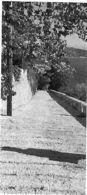
Φωτ.3. Αυτοψία 2022.

Φωτ. 1-2. Ο δρόμος που διανοίχτηκε το 2018, διαπιστώθηκε ότι έχει τσιμεντοστρωθεί.