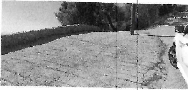
Φωτ.1 Αυτοψία 2022.