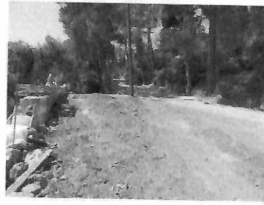
Φωτ.2 Αυτοψία 2018.

Φωτ. 1-2. Ο δρόμος που διανοίχτηκε το 2018, διαπιστώθηκε ότι έχει τσιμεντοστρωθεί.