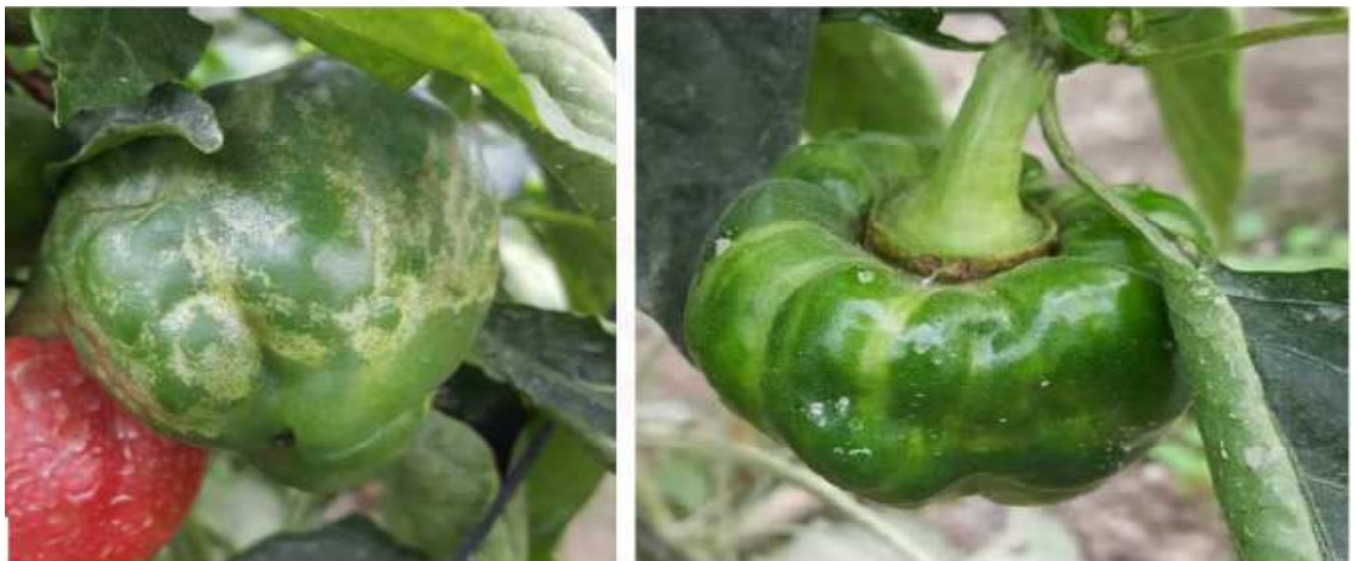
Παραμορφώσεις καρπών πιπεριάς, κίτρινες περιοχές και ραβδώσεις.