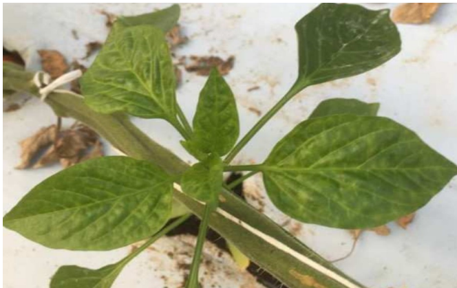
Μωσαϊκό και κιτρίνισμα νευρώσεων σε φύλλα πιπεριάς